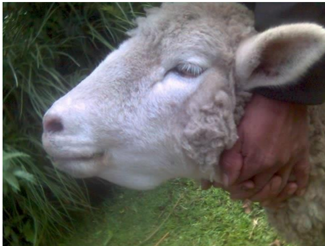
Ovino con síntomas de parásitos

Es recomendable que cuando se desparasita por primera vez, repetir la dosis a los 21 días con el mismo producto y cambiarlo la siguiente vez.