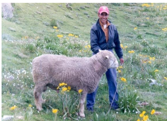
Cambio de semental