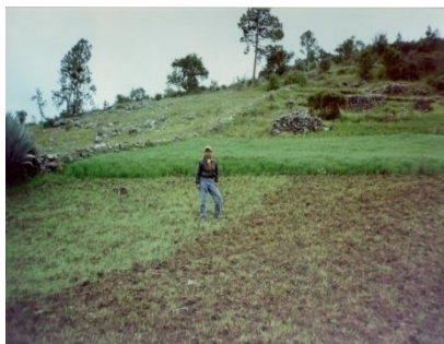
Siembra de avena

La avena es el forraje que se ha adaptado al área y de igual manera el que produce mayor cantidad de biomasa forrajera, se recomienda su establecimiento con el objetivo de incrementar y mejorar el nivel nutritivo de la ración. Se recomienda establecer de 6 cuerdas por cada tres ovinos importados, lo que alcanza para 6 o 7 meses, se debe cortar y almacenar ya sea henificado (en gabillas o manojos) o ensilado, manejando el punto óptimo de corte, para silo, grano lechoso masoso y para heno cuando este en etapa de floración (50%) y cuente con el mayor número de hojas.