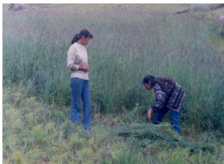
Zacatera con Pasto Dactylo

Cada Centro de Reproducción debe establecer como mínimo tres cuerdas de pasto Dactylo, el cual puede ser utilizado ya sea como pasto de corte en verde o como potrero bajo pastoreo controlado con la tecnología del redil móvil, en el cual se controlará la producción de biomasa forrajera para determinar la carga animal, proponiéndose en general un período ocupacional de cinco días y un período de recuperación del mismo de 45 días.